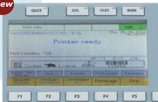
L'ampio display a colori 1/4 VGA è standard