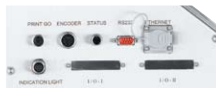
Semplice pannello di connessione