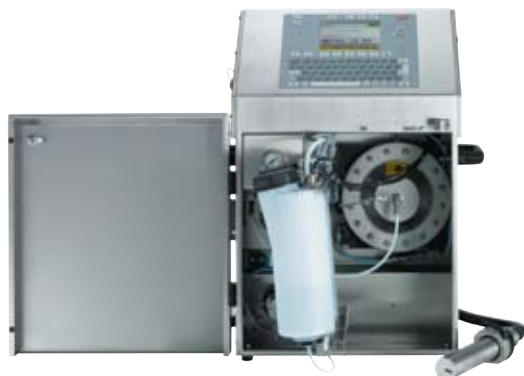
Facile accesso al sistema idraulico